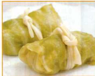
信州ロールキャベツ (50g/70g)