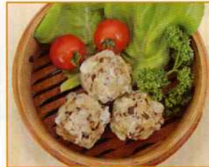
たっぷりきのこ焼売 (20g/30g/35g)