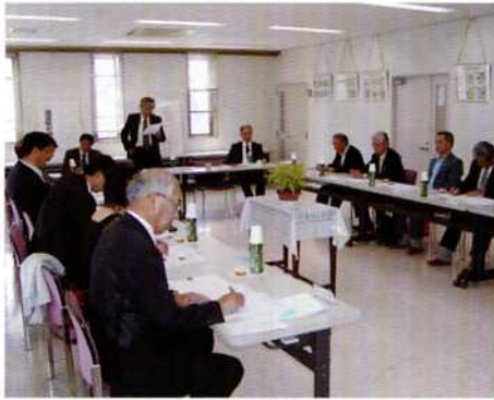
— 第1回評議員会 —

当面する課題として、「公益法人 制度改革の対応」「地産地消の良さ と問題点」等々について協議がなさ れ、諸般の情勢を的確につかみ、対 処・運営していくことが重要である というご意見をいただきました。