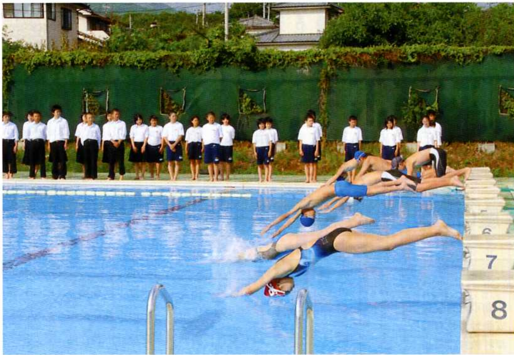
若アユのように(プール開き)