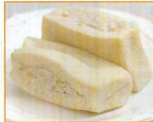
凍り豆腐の肉づめ (50g)