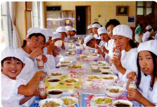
— ランチルームの給食 —

私達の学校の給食は、とても楽しいです。それは、全校が集まれる「ランチルーム」があって、みんなで食べるからです。 その他にも、給食を楽しく食べられる理由がたくさんあります。 まず、全校を縦割り班に分けて、その班で食べる「縦割り給食」があります。全校が普段から仲良しなので、このときは楽しさが倍増します。 次に、新緑の五月に行われる「若葉給食」や、紅葉のきれいな十一月に行われる「紅葉給食」があります。