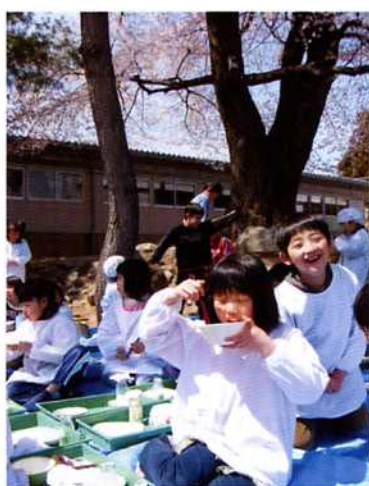
― 百年桜の下でお花見給食 ―

屋さんが直接運んでくれました。さすがにおいしかったですね。このような企画を立ち上げたおかげで市の広報課も給食に理解を深めてくださるようになり、「釜揚げしらす」の給食の日は報道