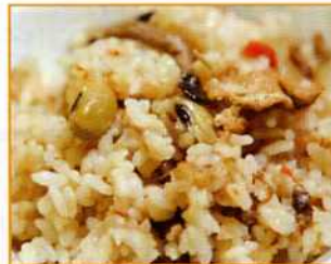
味ごはん吹き寄せ風 (レトルト 1kg・炊き込み用)