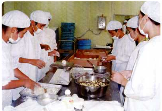
— 郷土学習 —

私が中学校に入学すると共に生坂村には給食センターができました。小学生のころは別の場所から運ばれてきて何気に食べていた給食でしたが、今年、保健委員になり改めて「給食」について考えてみました。 まず給食は多くの方の協力があつて作られています。新しくできた給食センターは、栄養