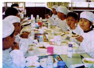
― 新1年生の給食 ―

子供達の食を間近で見つめることができ、三年目になる。子供達の食の姿からその子のすべてを背景までもが見えてくるようになった。食べ物大切にしている子、何でもよく食べる子はいろいろな場面においても感謝の気持ちが自然に表情に出てきてしかも言葉にもできている。そしていつも心が満たされているすがすがしい。給食で苦手な食材をクリアーしがんばれた子が自然と私に向かつて「ありがとうござ