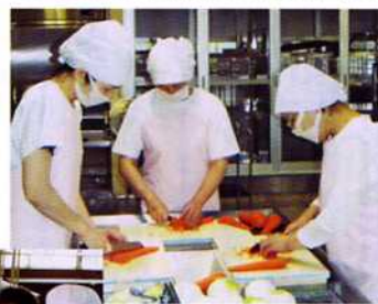
― 心をこめて ―