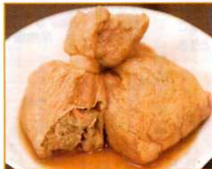
きのこ入り信田袋 (80g)