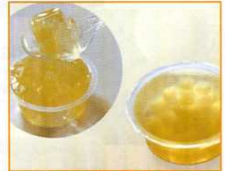
りんごっこゼリー (60g)

この他に「凍り豆腐サンドフライ」「おからカレーコロッケ」「アスパラと豚肉の信州春巻」があります。