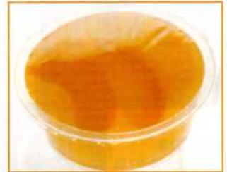
あんずっこゼリー (60g)